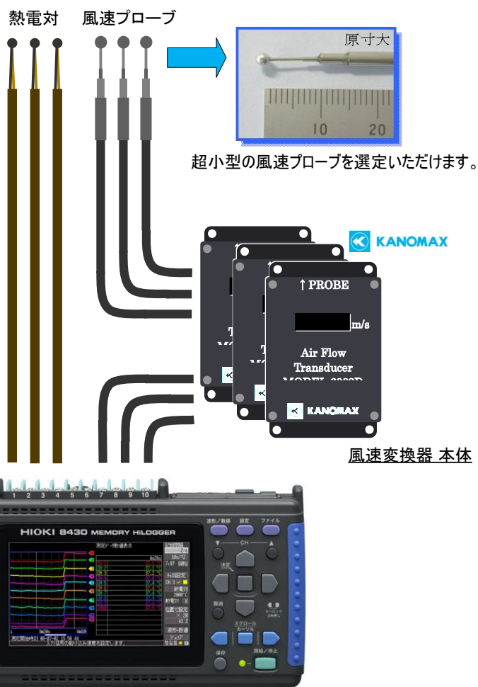
メモリハイロガー8430